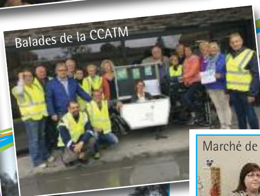
Balades de la CCATM