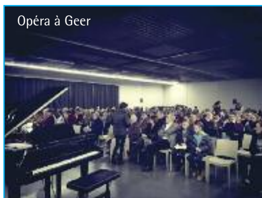
Opéra à Geer