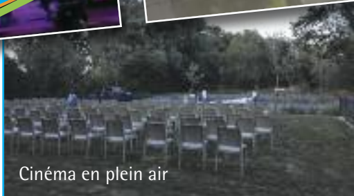
Cinéma en plein air