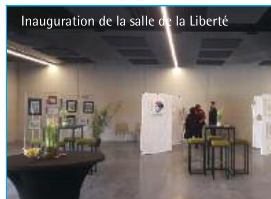
Inauguration de la salle de la Liberté