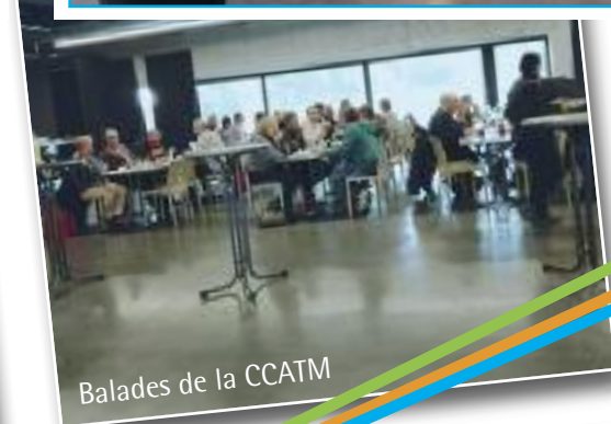
Balades de la CCATM