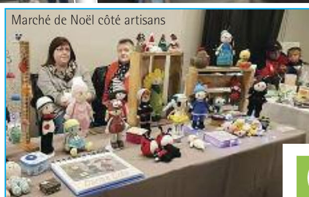
Marché de Noël côté artisans